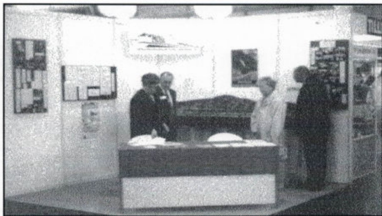
Der MOBA-Infostand - klein aber fein - auf der MODELL & HOBBY in Leipzig