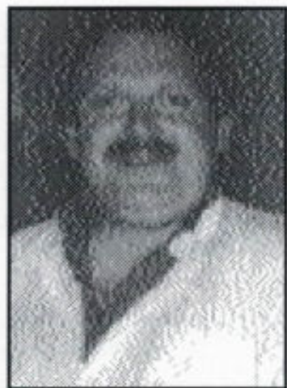
Hier sieht man deutliche wie sich "Scheich Ebe" wohlfühlt

Vereine, die an diesen Veranstaltungen teilnehmen möchten, schicken bitte ihre Bewerbungsunterlagen an die MOBA-Messe-Geschäftsstelle, c/o K.F. Ebe, Hauptstr.127a, 58675 Hemer. MK